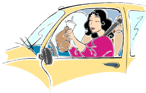
Comida rápida en el carro