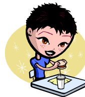
Come a diferentes horas